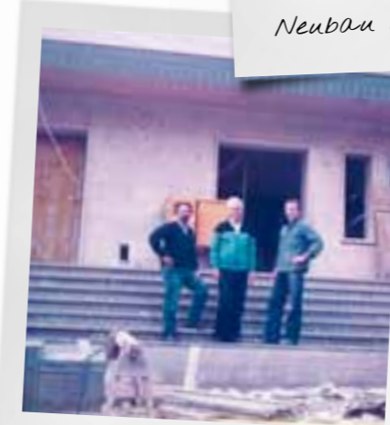
Neubau Hochbehälter 1983