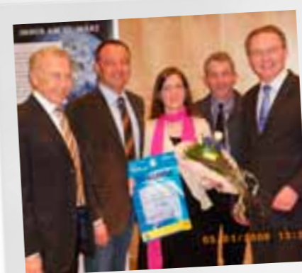
Siegerehrung „Junge Forschung Wasser 2010“