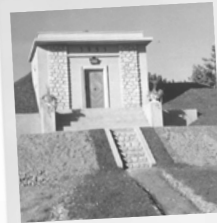
Neubau Hochbehälter 1951